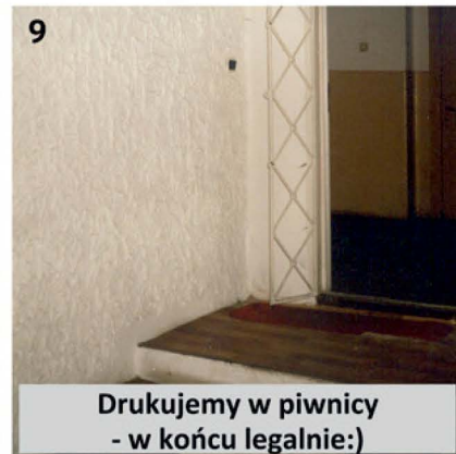
9 Drukujemy w piwnicy - w końcu legalnie :)