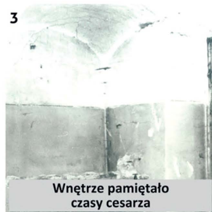
3 Wnętrze pamiętało czasy cesarza