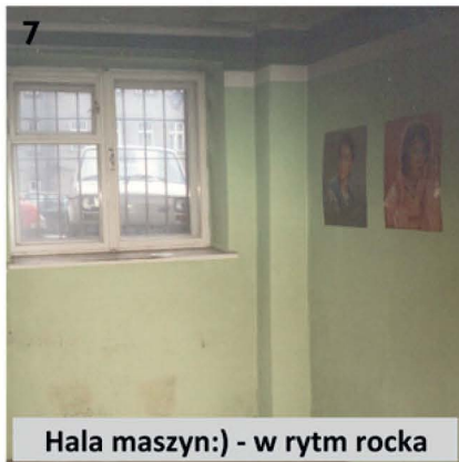
7 Hala maszyn :) - w rytm rocka