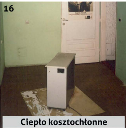
16 Ciepło kosztochłonne