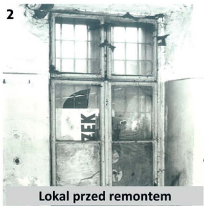
2 Lokal przed remontem